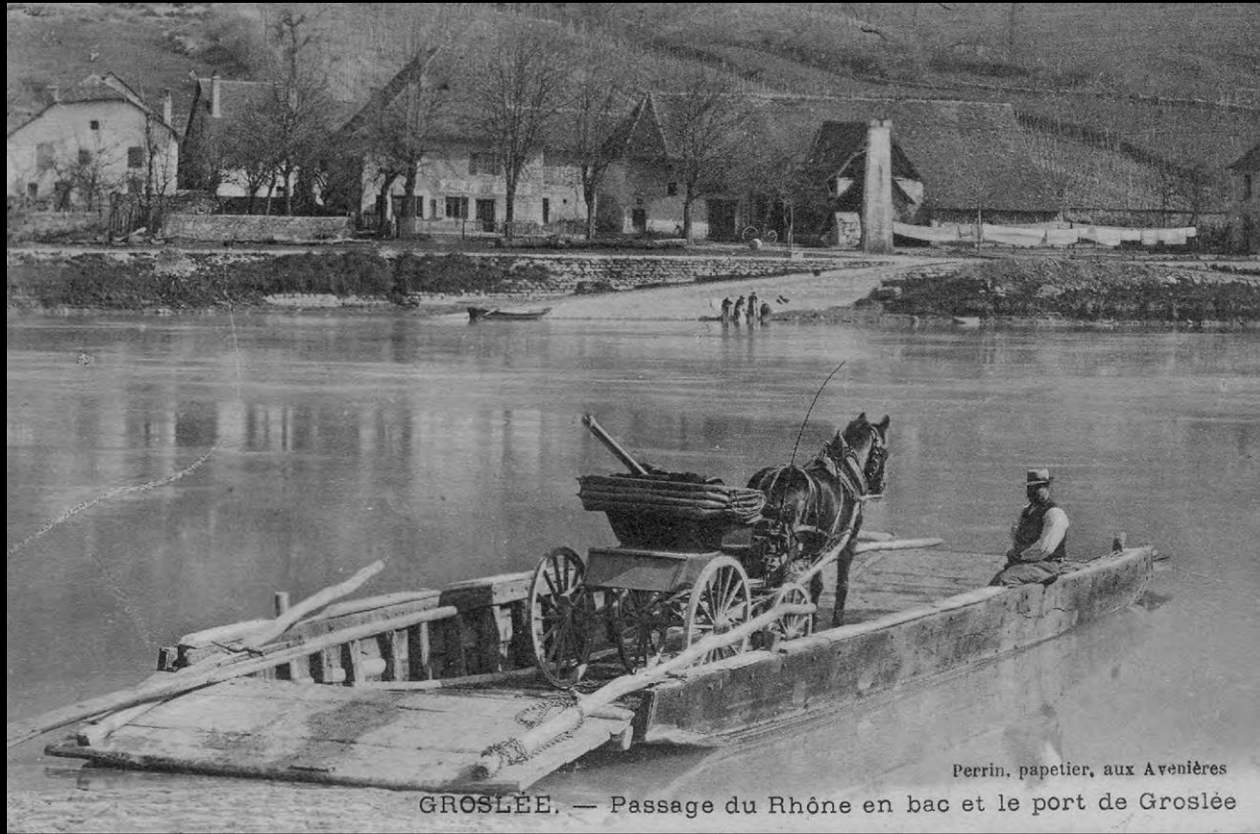
Perrin, papetier, aux Avenières GROSLÉE. — Passage du Rhône en bac et le port de Groslée