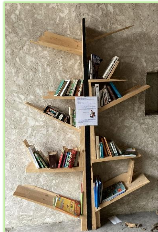
L'ARBRE A LIVRES