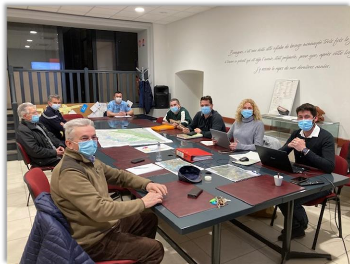
CELLULE DE CRISE – MAIRIE DE BRANGUES

De mémoire de nos aînés, les sorties du lit du fleuve sont moins fréquentes, mais cela ne doit pas nous faire oublier le besoin de se préparer et pour les riverains d'être déclarés dans les dispositifs de télé-alerte en mairie.