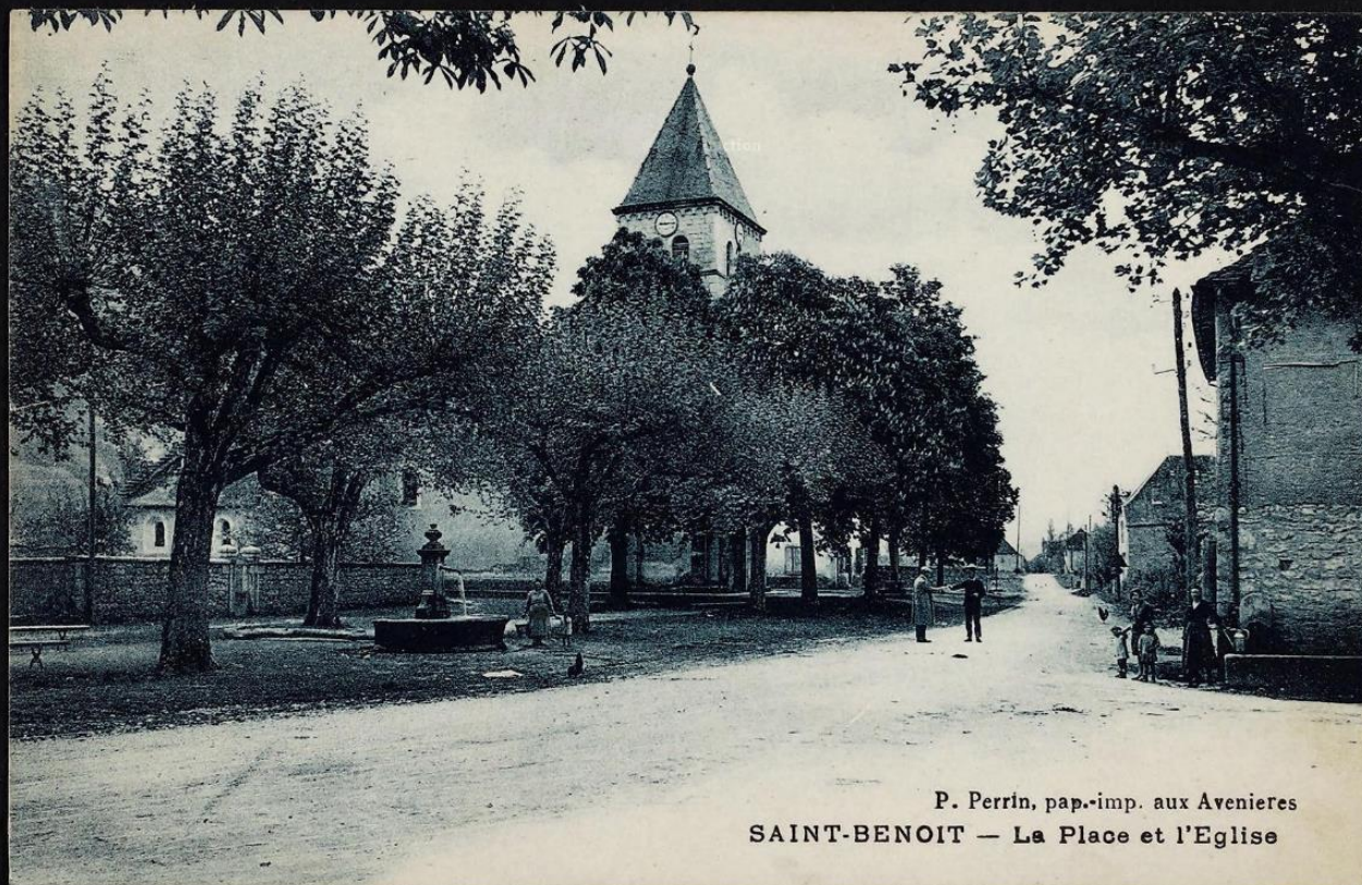
P. Perrin, pap.-imp. aux Avenieres SAINT-BENOIT — La Place et l'Eglise