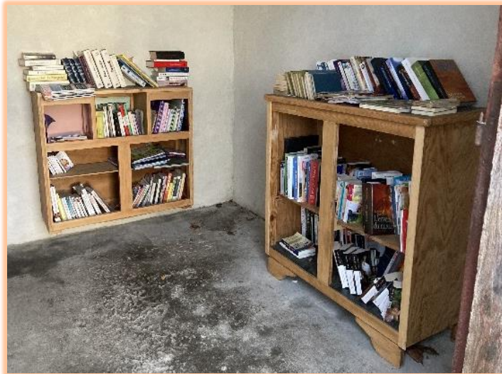
LA BIBLIOTHEQUE BUFFET

Amoureux de la lecture, venez découvrir « l'arbre à livres » au four de Glandieu, « la bibliothèque banquette » au Pont Bancet à Groslée, « la bibliothèque buffet » dans l'ancienne gare restaurée du tramway à Saint Benoit.