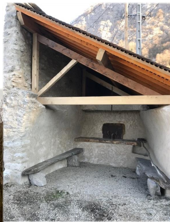
FOUR DU CHAMP