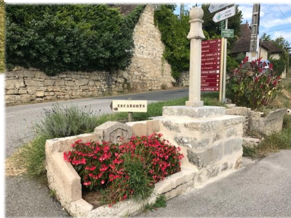
CALVAIRE PORT DE GROSLEE