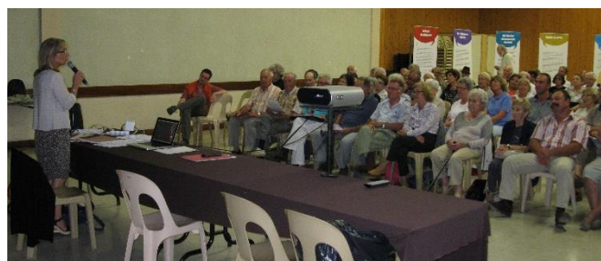
CONFERENCE A Lhuis : LE PATOIS (24/08/2013)