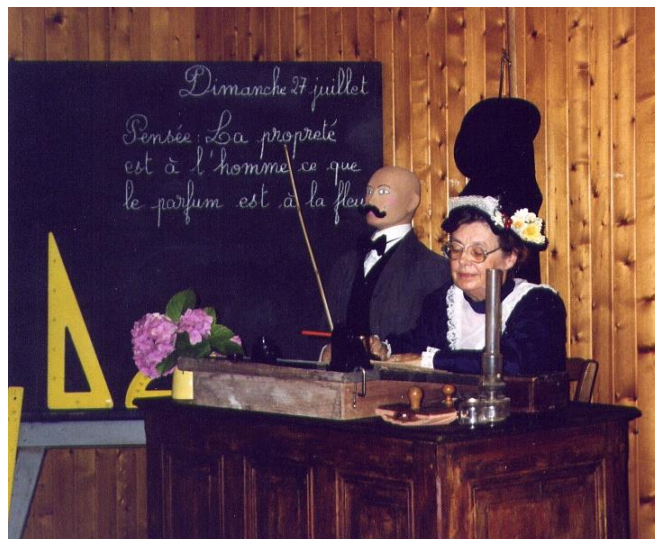
EXPO A Lhuis LES ECOLES DU CANTON (2003)

Helene.ville42@gmail.com _ O4 74 39 72 29