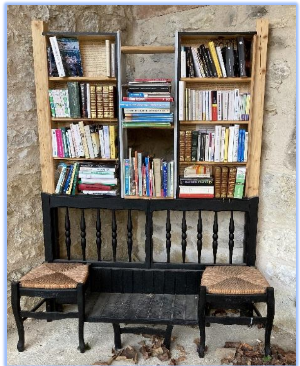
LA BIBLIOTHEQUE BANQUETTE

Le principe de la boîte à livre est basé sur l'échange. Son fonctionnement est fondé sur la confiance. Ouverte en permanence, elle est placée sous votre vigilance et votre protection.